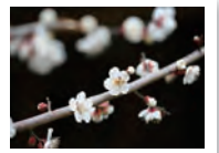
ほのかに香り始める梅の花