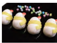
メリークリスマス★